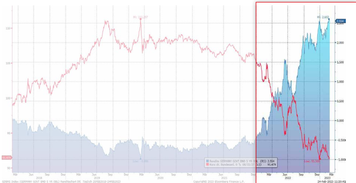
Grafik: Entwicklung Bundesanleihe vs. Renditeentwicklung

Das Jahr 2022 war ein rabenschwarzes Jahr am Rentenmarkt. Einen so scharfen und schnellen Renditeanstieg hat die Welt seit dem zweiten Weltkrieg nicht mehr gesehen. Die Anleihemärkte verzeichneten Verluste im zweistelligen Prozentbereich. Denn wenn das Zinsniveau steigt, fallen die Kurse von festverzinslichen Anleihen – abhängig von Laufzeit und Ausmaß des Zinsanstiegs.